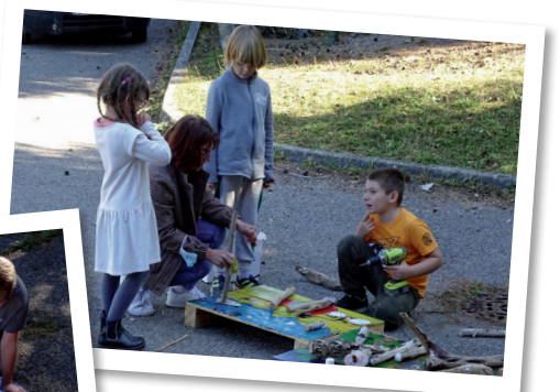
Fabrication de scènes imaginaires