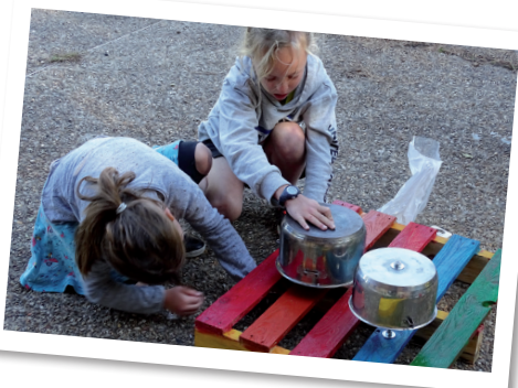
Fabrication de stands musicaux