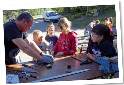
Fabrication de stands musicaux

Un damier géant est confectionné à partir de palettes et de galets. Les enfants se sont appliqués à tracer le damier et peindre minutieusement chaque case. Cela leur a demandé beaucoup de réflexion, de dextérité, de concentration et de patience.