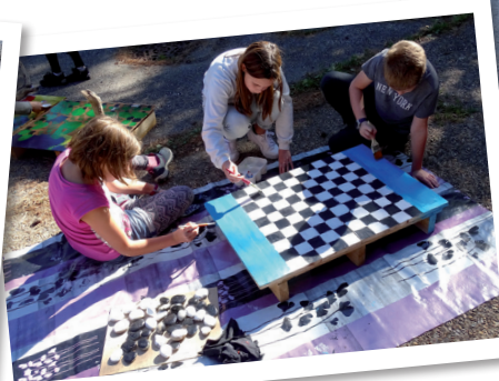
Fabrication d'un damier géant